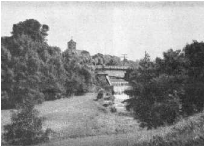
An der Schleusenbrücke von Heiligenbeil Im Hintergrund der wuchtige Turm der alten Heiligenbeiler Ordenskirche.